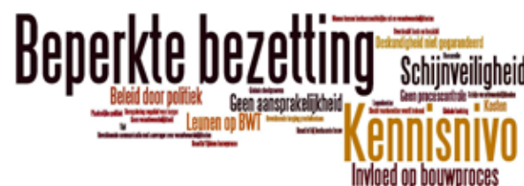
Figuur 4. Wordle van de nadelen van het huidige bouwtoezicht.

twee parallelsessies. Uit die sessies zijn nog enkele aanvullende aandachtspunten naar voren gekomen. Behoeften, die uit het onderzoek naar voren zijn gekomen: