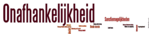
Figuur 3. Wordle van de voordelen van het huidige bouwtoezicht.